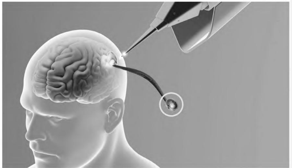
Η ιδέα της σύνδεσης εγκεφάλου - μηχανής δεν είναι νέα. Επί δεκαετίες αποτελεί έναν από τους πιο φιλόδοξους στόχους της επιστημονικής έρευνας. Παρόμοια συστήματα έχουν εμφυτευθεί στον εγκέφαλο όχι μόνο πειραματόζωων, αλλά και ανθρώπων.

Επί του παρόντος, βέβαια, όλες αυτές οι έρευνες είναι περιορισμένες στα εργαστήρια. Οι εμφυτευμένες διεπαφές είναι ακριβές και απαιτούν εκπαίδευση τόσο του χρήστη όσο και του ηλεκτρονικού υπολογιστή. Όταν, μάλιστα, εμφυτευθούν ενδοκρανιακά, συνήθως επιβάλλουν τη διαρκή φυσική σύνδεση του ασθενούς με έναν ηλεκτρονικό υπολογιστή, ενώ κάποιες λειτουργίες, όπως η ηλεκτρολόγη-