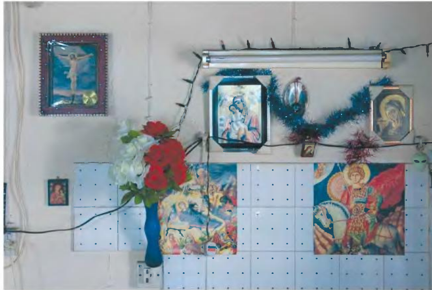
«Coffee House Embellishments», Νίκος Φιλίππου, 2008.

Η επιμέλεια της έκθεσης έγινε με βάση την έρευνα της Ασπασίας παράλληλα με τα έργα τέχνης δημιουργώντας μια αφήγηση μέσα από ενότητες. «Εντόπισα έργα καλλιτεχνών από παλαιότερες γενιές, όπως των ζωγράφων Διαμαντή και Βίκτωρα Ιωαννίδη, έργα που στόχο είχαν κυρίως την απεικόνιση των καφενείων, της παράδοσης των καφενείων ως χώρων συνάντησης των ανδρών, κυρίως κατά τις δεκαετίες του '50 και '60. Βέβαια, πίσω από αυτήν την απεικόνιση παρατηρεί κανείς στοιχεία της κοινωνίας της εποχής, μια σημειολογική ανάλυση που μπορούμε να κάνουμε εμείς σήμερα με ένα σύγχρονο βλέμμα. Μετά παρατήρη-