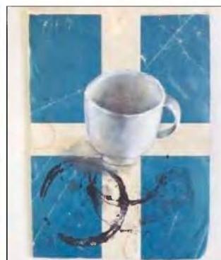
Ανδρέας Νικολάου, «Τύχη II», ακρυλικό σε χαρτί, 2012 - Συλλογή του καλλιτέχνη