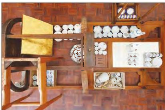
Μαριάννα Κωνσταντή, «Προίκας παρακαταθήκη», mixed media, 2020.