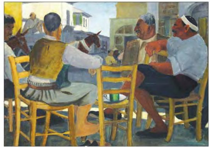
Αδαμάντιος Διαμαντής, «Αμαξήρες της Ασμαλίτ», λάδι σε καμβά, 1943 - Συλλογή Κρατικής Πινακοθήκης.