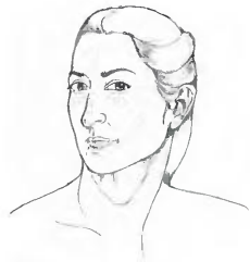
Γράφει η Ελένη Παπαδοπούλου

Τα μυστικά του καφέ και η σημασία του καφενέ στην κοινωνία της Κύπρου