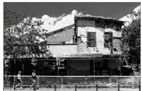
Kadir Kaba, «Once Spitfire coffee house», Λευκωσία 2007.