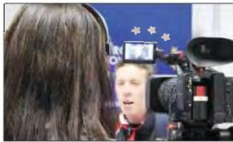
Τον Ιούνιο στο Πισσούρι με τη συνεργασία και του ΤΕΠΑΚ

Το πρόγραμμα απευθύνεται σε φοιτητές τμημάτων Δημοσιογραφίας και ΜΜΕ, Κοινωνικών Επιστημών, Φιλολογίας, Ιστορίας, μεταπτυχιακούς φοιτητές συναφών σπουδών και σε όσους εργάζονται ή έχουν εργαστεί ως δημοσιογράφοι. Ο συνολικός αριθμός των συμμετεχόντων δεν θα υπερβεί τα 12 άτομα. Οι διδάσκοντες είναι μέλη ΔΕΠ - ΕΕΠ τμημάτων ΑΕΙ, επαγγελματίες δημοσιογράφοι, καθώς και