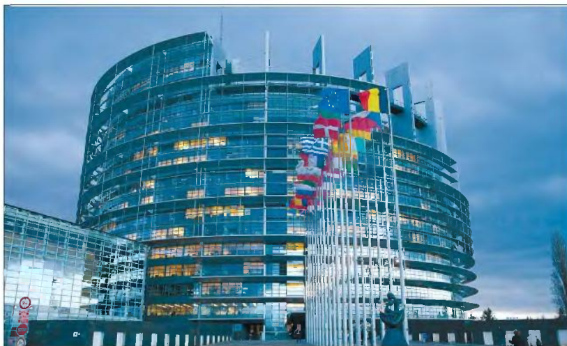
Στο τελευταίο στάδιο της εισαγωγής νέων ιδίων πόρων, που τοποθετείται στη διετία 2024-26, το διαπραγματευτικό πακέτο περιλαμβάνει έσοδα από εταιρείες ή από μια νέα κοινή βάση φορολογίας εταιρειών.

Ο Μηχανισμός Ανάκαμψης και Ανθεκτικότητας της Ευρωπαϊκής Ένωσης θα διοικηθεί στα κράτη μέλη της ΕΕ κονδύλια ύψους 750 δισ. ευρώ. Αυτή η μεγάλη κλίμακα δημοσιονομική παρέμβαση για να αντιμετωπιστούν οι βαριές οικονομικές επιπτώσεις της πανδημίας οδηγεί την ΕΕ στην πρώτη έκδοση κοινού χρέους (η Επιτροπή θα δανειστεί από τις αγορές για να χρηματοδοτήσει τον μηχανισμό) και ανοίγει τον δρόμο για μεγαλύτερη οικονομική αυτονομία της Ένωσης μέσω της σταδιακής μεταρρύθμισης του συστήματος των ιδίων πόρων. Η αρχή έχει ήδη γίνει με τη θεσμοθέτηση ενός φόρου επί των πλαστικών, ενώ στο τελευταίο στάδιο, που τοποθετείται στη διετία 2024-26, το διαπραγματευτικό πακέτο περιλαμβάνει έσοδα από εταιρείες ή από μια νέα κοινή βάση φορολογίας εταιρειών.