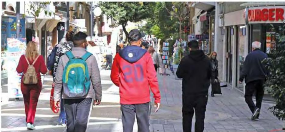
Το να «πουλάει» η Κύπρος το μοντέλο της φορολογικής έδρας δεν έχει ιδιαίτερο μέλλον, διότι αν δεν καταφέρει η ρύθμιση Μπάιντεν να περάσει, κάποια στιγμή θα επανέλθει αντίστοιχη.

Η Κύπρος είναι μια χώρα που δεν μεταβάλλει το φορολογικό της σύστημα, δίνοντας μια ασφάλεια στους επενδυτές που θέλουν να δραστηριοποιηθούν ή να μεταφέρουν την φορολογική τους έδρα.