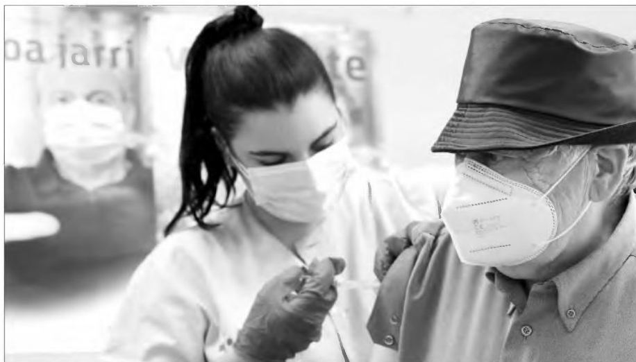
ΔΙΣΤΑΚΤΙΚΟΤΗΤΑ ΕΝΑΝΤΙ ΤΩΝ ΕΜΒΟΛΙΩΝ - ΤΙ ΜΠΟΡΕΙ ΝΑ ΓΙΝΕΙ