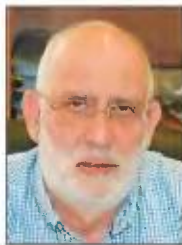
Του ΧΡΗΣΤΟΥ ΚΑΡΥΔΗ

Τούτων εισαγωγικώς λεχθέντων υποστηρίζουμε πως αυτή την ώρα στην Κύπρο χρειάζεται ποιτική και ποσοτική αναβάθμιση της Τεχνικής Εκπαίδευσης και της Επαγγελματικής κατάρτισης,