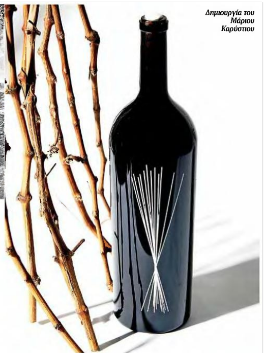
Δημιουργία του Μάριου Καρύστιου