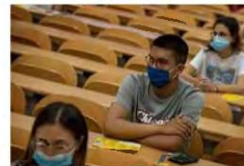
Του Χαρίδημου Κ. Τσούκα

Ναι, αλλά τι γίνεται με τους ανεμβολιαστούς; Θα αποκλεισθούν; Όχι, βέβαια. Εφόσον πιστεύουμε στην ιούτιμη ευκαιρία, θα αναζητήσουμε τους καλύτερους δυνατούς τρόπους πρόσβασης των ανεμβολιαστών στην εκπαιδευτική διαδικασία, όπως, αντιστοίχως, αναζητούμε τρόπους πρόσβασης των