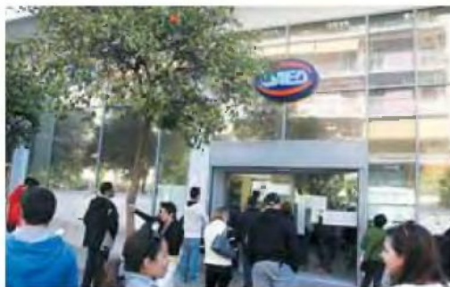
Ο στόχος του υπουργείου Εργασίας και της διοίκησης του ΟΑΕΔ είναι η έναρξη υποβολής αιτήσεων να πραγματοποιηθεί εντός του Οκτωβρίου, έτσι ώστε στα τέλη Νοεμβρίου να τοποθετηθούν οι άνεργοι στις θέσεις τους.