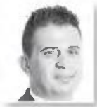
Του Ζαχαρία Ι. Μανταρά*

Τ ο πρόβλημα της έλλειψης τεχνικά καταρτισμένου προσωπικού είναι ένα από τα σημαντικότερα προβλήματα που αντιμετωπίζουν σήμερα οι κυπριακές επιχειρήσεις. Η έκταση του προβλήματος, μάλιστα, είναι τέτοια, που σε πολλές περιπτώσεις οι επιχειρήσεις αναγκάζονται να υπολείπουν. Την ίδια ώρα, επειδή δεν υπάρχει διάδοχη κατάσταση των τεχνικών που συνταξιοδοτούνται, υποχρεώνονται οι επιχειρήσεις να προβαίνουν σε συμφωνίες παράτασης της εργασίας τους.