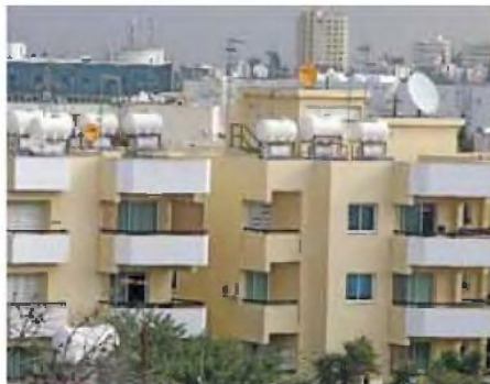
Στο νέο μοντέλο εξεύρεσης κατοικίας δεν θα διαδραματίζει προεξάρχοντα ρόλο η εγγύτητα σε πεθερές και παππούδες για να κουβαλούν με ευκολία τα παιδιά σε ιδιαίτερα, αλλά η ευκολία πρόσβασης στον χώρο εργασίας.

Το πρόβλημα επιλύεται με διάφορους τρόπους, δύο από τους οποίους είναι: πρώτον, να καλλιεργούμε τους περιορισμούς περί απασχόλησης ατόμων από τρίτες χώρες και δεύτερον, να δημιουργήσουμε εκείνες τις συνθήκες μεταξύ επιχειρηματικού κόσμου και ακαδημαϊκών ιδρυμάτων τριτοβάθμιας εκπαίδευσης έτσι ώστε να εκπαιδευθούν προπτυχιακά προ-