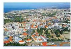
Από 45.965 παύι καταγράφηκε το 2001 θα φτάσει στις 104.466 το 2026

Εκτόξευση του πληθυσμού καταγράφεται στην Πάφο το τελευταίο χρόνο και σύμφωνα με τις εκτιμήσεις, μέχρι το 2026 ο πληθυσμός θα αυξηθεί πενήντα. Με βάση τις εκτιμήσεις στο έργο του νέου Τοπικού Σχεδίου Γόρμου, που περιλαμβάνει την πόλη της Πύρου, η προσέλευση καθώς και τις γύρω κοινότητες, ο πληθυσμός από 45.965 που ήταν το 2001 θα υπερδιπλασιαστεί το 2026 φτάνοντας στις 104.466. Το έτος 2011 ο πληθυσμός ήταν, σύμφωνα με την απογραφή 62.122 και φέτος αναμενόμενος να φτάσει στις 85.582. Στο Δήμο Πύρου που είναι ο μεγαλύτερος από το 2001 μέχρι το 2011 σημειώθηκε αύξηση 23,98% ενώ ο πληθυσμός από 26.530 το 2001 εκτιμάται ότι θα φτάσει στις 45.669 το 2026.