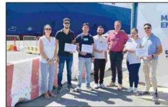
This marks the third consecutive year of DP World Limassol's steadfast commitment to nurturing the leaders of tomorrow

graduate students hailing from the Cyprus University of Technology (Τεπακ) and European University Cyprus, offering them invaluable hands-on experience within their chosen career paths. The company explained that over the course of the internship, these students joined forces with DP World Limassol's workforce, actively contributing to a range of projects. DP World Limassol noted that their time with the company not only provided them with skill enrichment but also bestowed them with significant practical job experience.