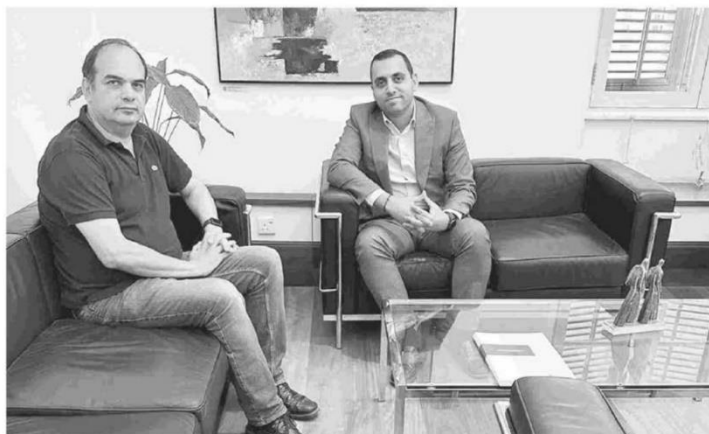
Ο βουλευτής Ανδρέας Αποστόλου συναντήθηκε πρόσφατα με τον πρόεδρο του ΤΕΠΑΚ Παναγιώτη Ζαφείρη, με τον οποίο συζήτησε τα επόμενα βήματα αναφορικά με την ίδρυση της σχολής στη Λάρνακα.