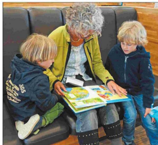
language intervention for children with DLD has been proven beneficial

Firstly, children with DLD may experience learning difficulties, affecting both written expression and reading comprehension. For example, a child may be a proficient reader but have severely limited text comprehension skills. Additionally, these children often face social challenges