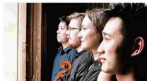
Το Simply Quartet ερμηνεύει έργα Σούμαν, Χάιντν και Βέμπερν.