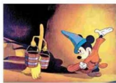
Τραγουδία και μουσικά θέματα από τις πιο αγαπημένες ταινίες της Disney στο Διεθνές Φεστιβάλ Λευκωσίας.