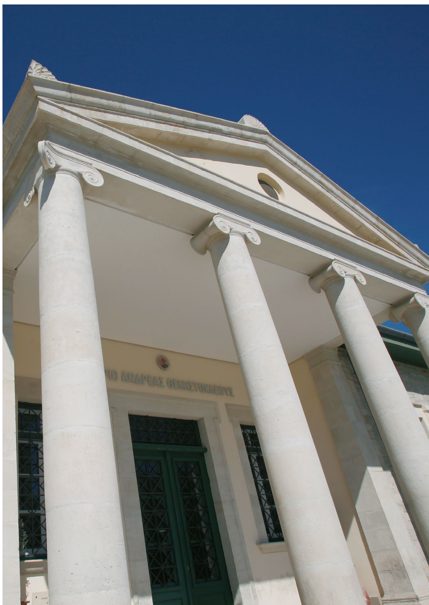
Κτήριο «Ανδρέας Θεμιστοκλέους» στη Λεμεσό