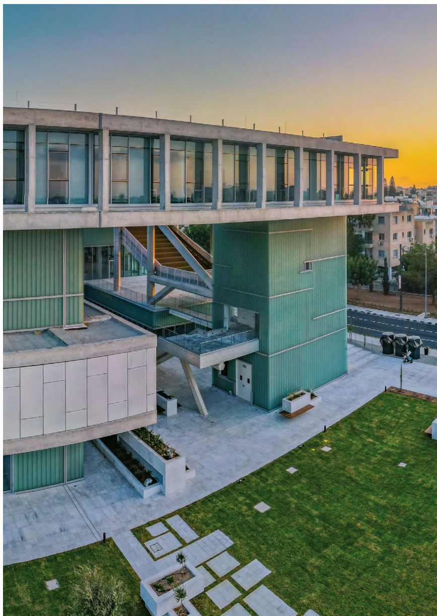
Κτήριο Σχολής Διοίκησης Τουρισμού, Φιλοξενίας και Επιχειρηματικότητας στην Πάφο