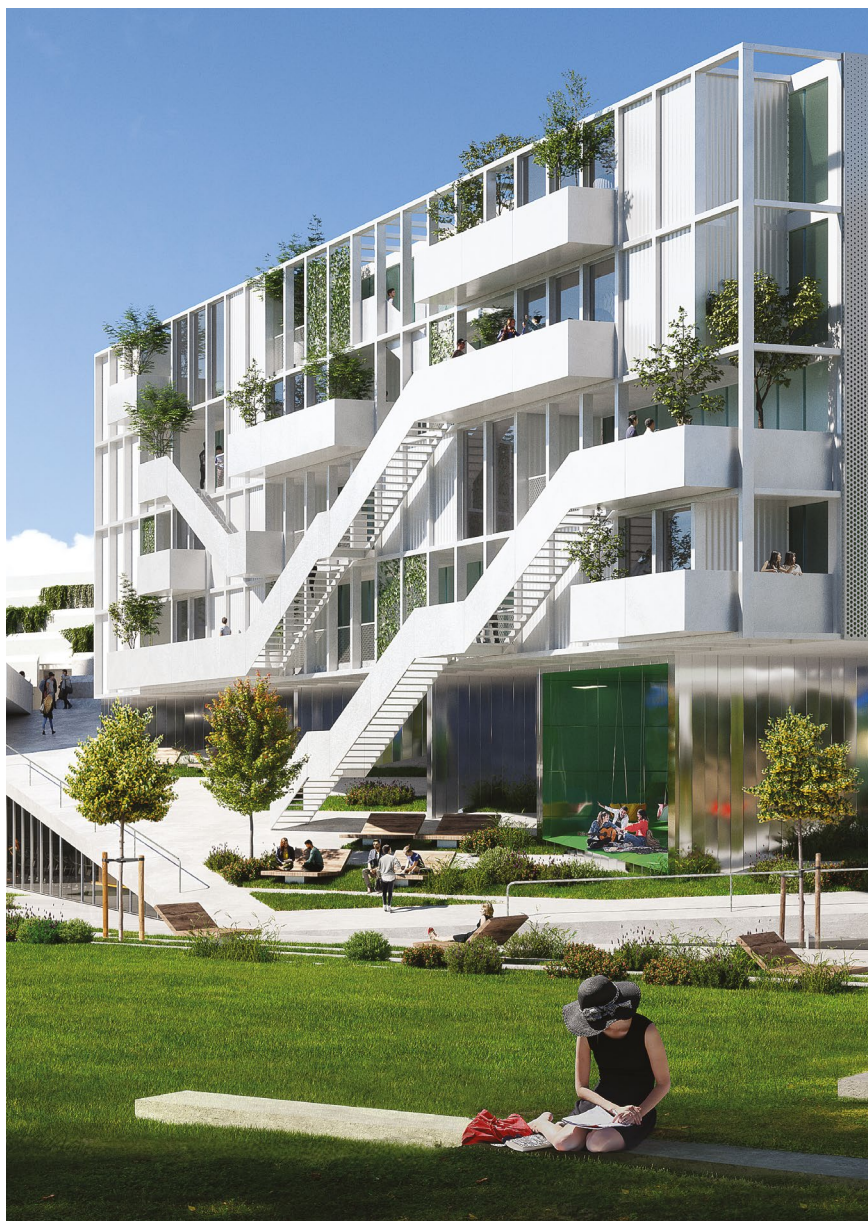
Φωτορεαλιστική απεικόνιση του υπό ανέγερση κτηρίου Φοιτητικών Εστιών στη Λεμεσό