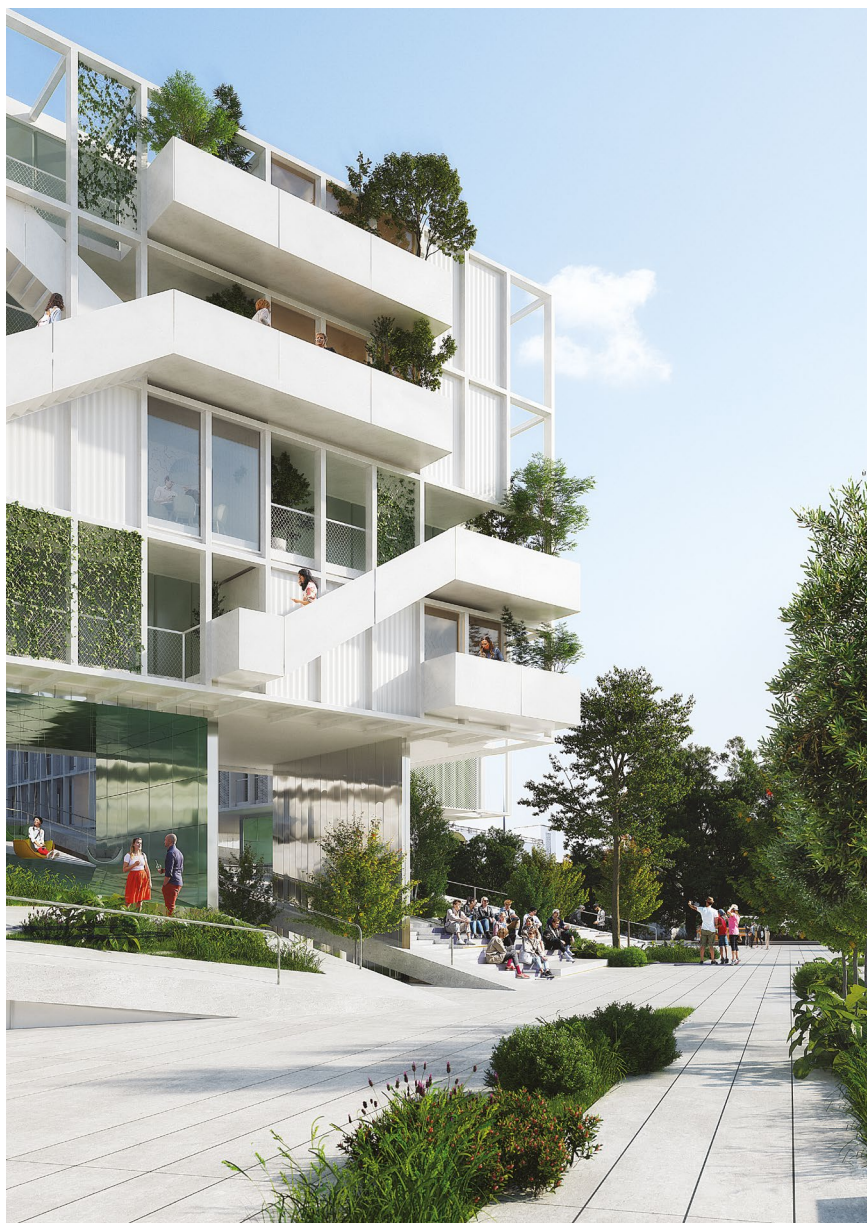
Φωτορεαλιστική απεικόνιση του υπό ανέγερση κτηρίου Φοιτητικών Εστιών στη Λεμεσό