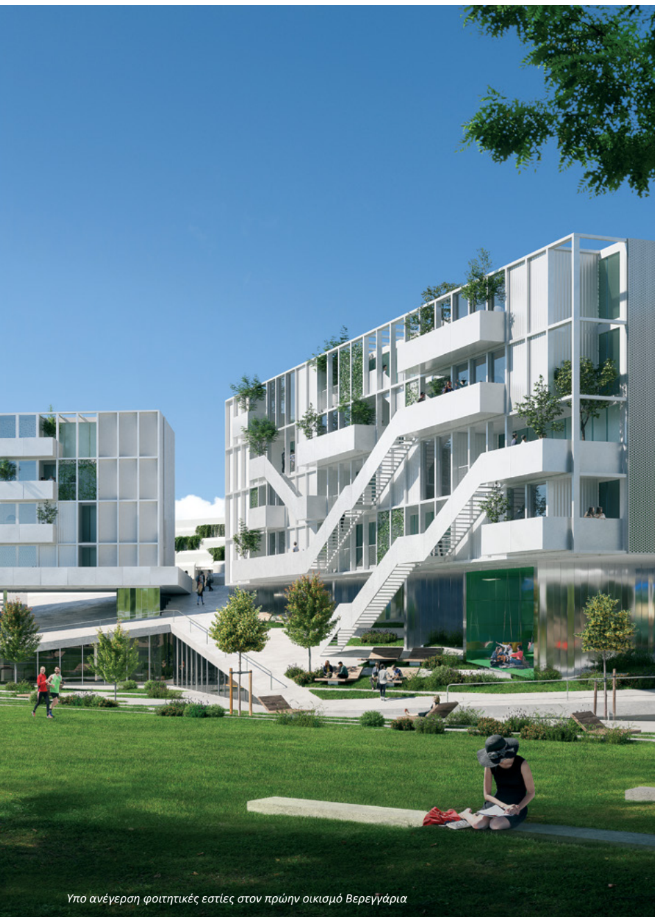
Υπο ανέγερση φοιτητικές εστίες στον πρώην οικισμό Βερεγγάρια